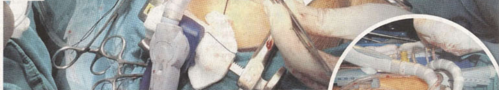
PEMBEDAHAN bypass jantung Minimally Invasive Cardiac hanya meninggalkan luka yang kecil.